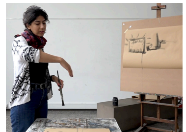
Abb. 4 Gestische Beschreibung einer Kurve, Studie E-Tankstelle.