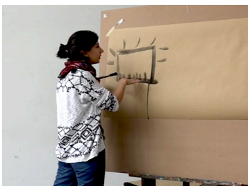
Abb. 2 Gestische Beschreibung der reinfahrenden Autos, Studie E-Tankstelle

37 Im Gegensatz zum Observer View-Point, Vgl. McNeill 1992