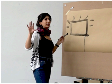
Abb. 1 Gestische Beschreibung des leuchtenden Billboards, Studie E-Tankstelle