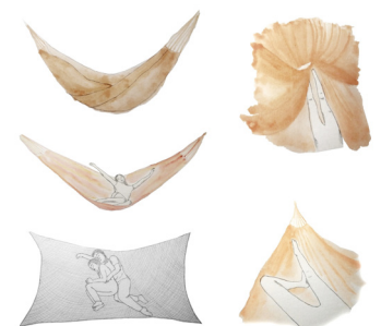
Abb. 5 Detail der Interaktion des Körpers mit seiner nächsten Umgebung. Studentische Arbeit von Jael Choppé.