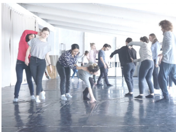
Abb. 2 Die Studierenden spüren die anatomische Verbindung von Kopf und Steiß in eigenem Körper. Das begleitende Auflegen der Hände bringt das Körperinnere und die Ausrichtung im Außenraum zum Vordergrund der Aufmerksamkeit. Fotodokumentation des Seminars.

Um diese körperliche Imagination eines erdachten Raumes mit den Studierenden zu erreichen, wurden ausgewählte somatische Praktiken zuerst vorgestellt, dann geübt und vertieft. Begonnen wurde mit solchen Übungen, welche die Aufmerksamkeit der Praktizierenden auf das Körperinnere lenken – auf eigene innere Prozesse wie das Abgeben des Körpergewichtes durch die Füße in den Boden oder das taktile und propriozeptive Spüren der anatomischen Verbindung von Kopf und Steiß durch entsprechendes Auflegen der Hände. Abb. 2 zeigt eine solche Übung. Es folgten weitere Übungen, die den unmittelbaren Raum um den Körper herum fokussierten – erfahrbar als funktionaler Raum der Reichweite der Extremitäten; als sozialer Raum der gesellschaftlich vorgeschriebenen Nähe und Distanz oder als existenzieller Raum